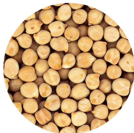
FOTO GARBANZO PEDROSILLANO ECO