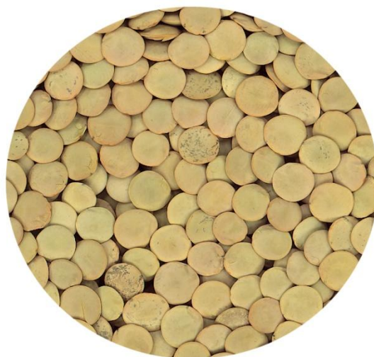
FOTO LENTEJA CASTELLANA ECO