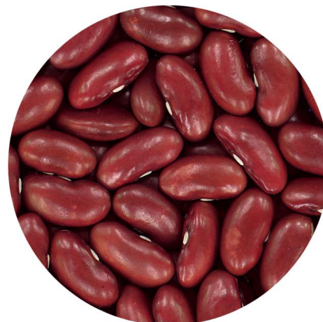
FOTO ALUBIA MORADA ECO