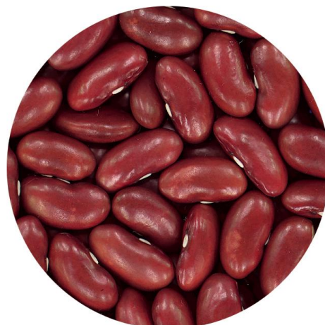
FOTO ALUBIA MORADA LARGA