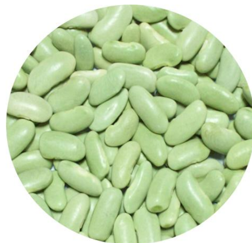
FOTO ALUBIA VERDINA